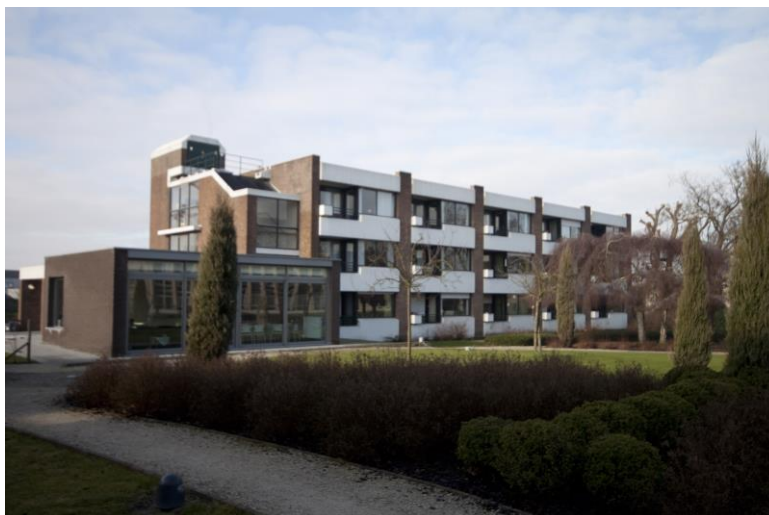
Groep van Assistentiewoningen Residentie Ampe